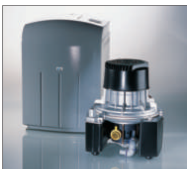
VSA 300 S