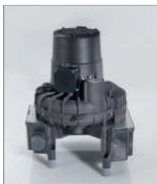
V 900/V 1200