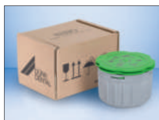
Recyclingbox CAS 1