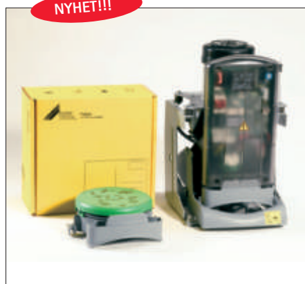
Recyclingbox CA4/Amalgamavskiljare CA4