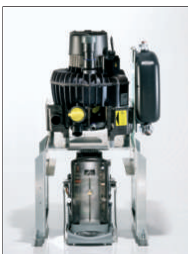
VS 900 och CA4 med golvstativ

VSA 1200 S (VS 1200 S i kombination med CA4)